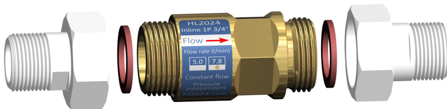
Afbeelding: voorbeeld montage HL2024 Inline 1P 3/4"

Verwijder eventuele bestaande volumestroombegrenzers bovenstrooms en benedenstrooms van het product om een optimale werking van het product te garanderen.