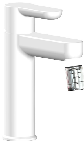
Afbeelding: HL2024 Tap M24 (afmetingen in mm)