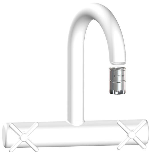
Afbeelding: HL2024 Tap M22 (afmetingen in mm)

Verwijder eventuele bestaande volumestroombegrenzers bovenstrooms van het product om een optimale werking van het product te garanderen.